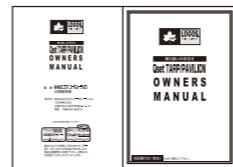
オーナーズマニュアル

設置やお手入れ等に便利な手引きや、注意事項などが書かれた「オーナーズマニュアル」が同梱されています。お出掛けになる前に必ずお読みください。また、事前に広い場所で部品のチェックと組立ての練習を行ってください。