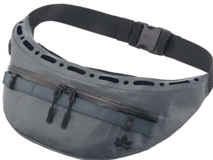
「野電 ボディエアコン・ツインクール」一般販売予定価格 13,970円（税込）