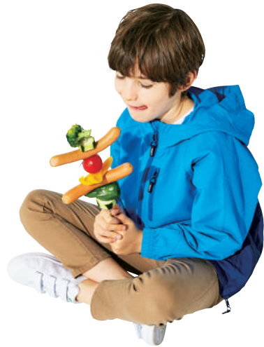
SON キャンピングアノラック2 ¥8,900