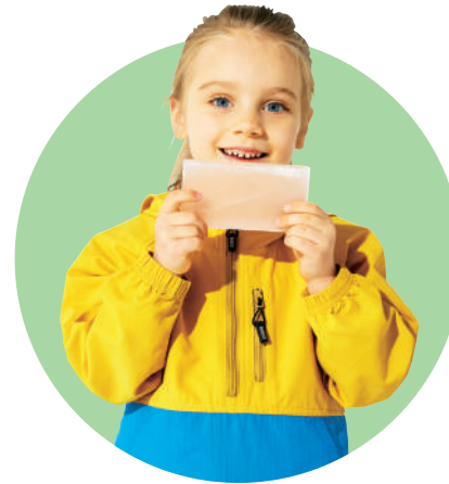
DAUGHTER キャンピングアノラック2 ¥8,900