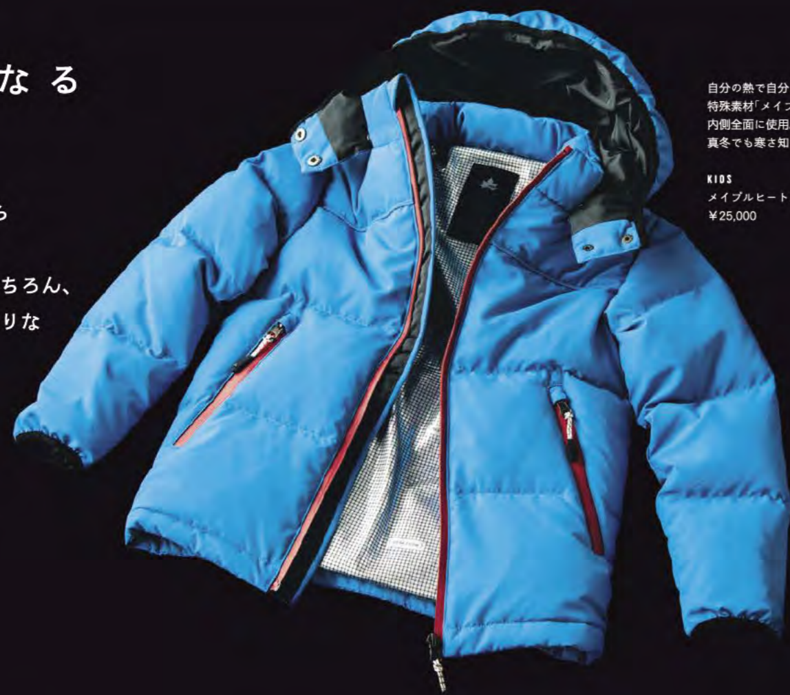
STYLING / SHUNSUKE OKABE (UM) TEXT / SHINOBU ABE

自分の熱で自分をあたためる 特殊素材「メイプルヒート」を 内側全面に使用。 真冬でも寒さ知らずなジャケットです。