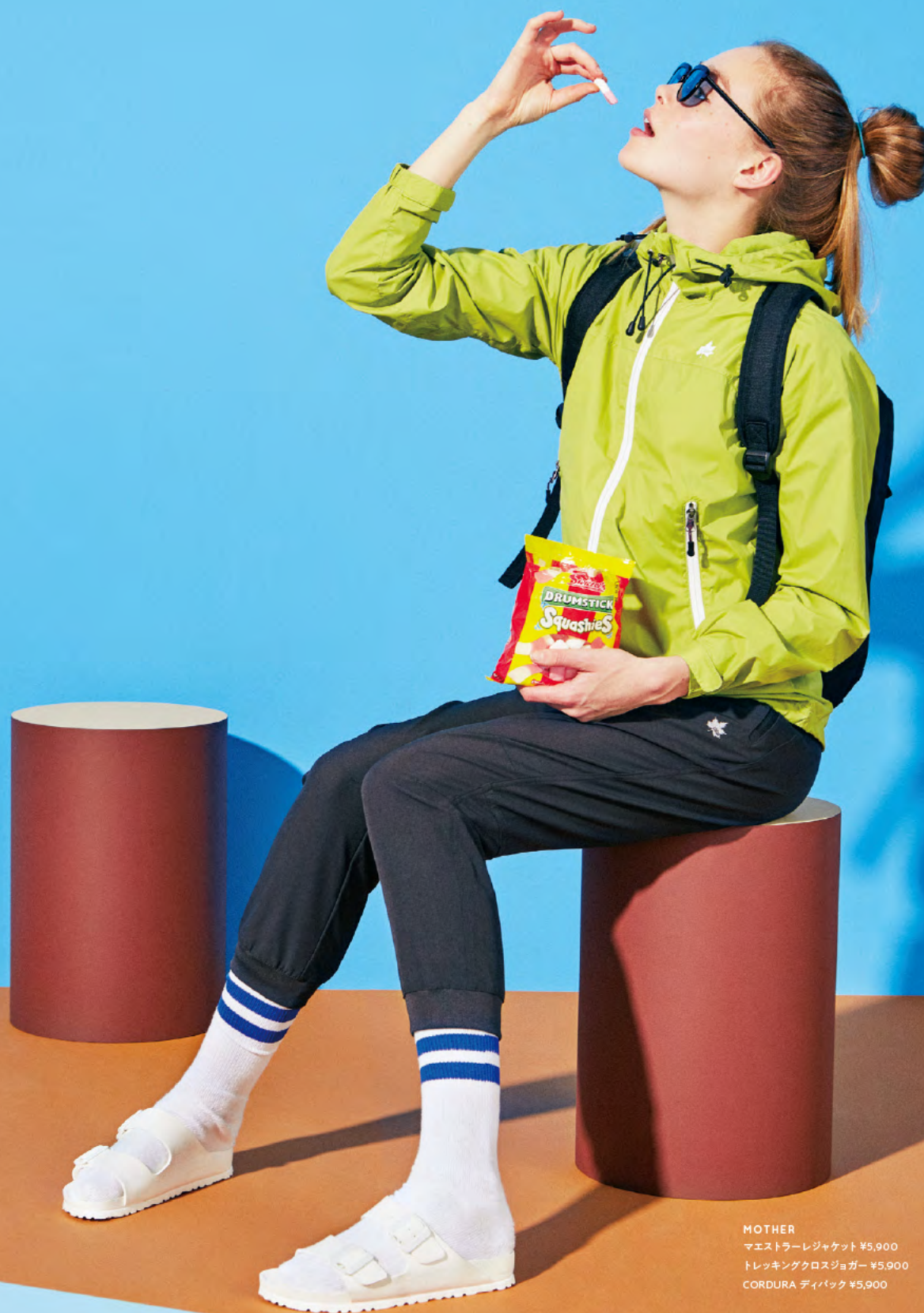
MOTHER マエストラレジャケット ¥5,900 トレッキングクロスジョガー ¥5,900 CORDURA ディバック ¥5,900