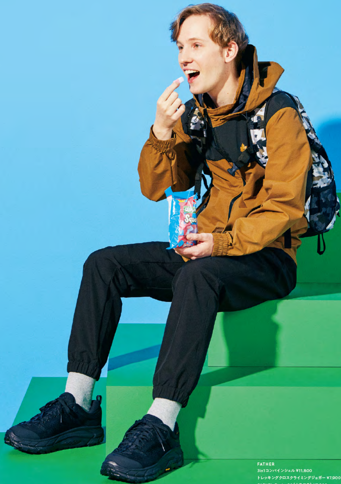
FATHER 3in1コンバインシェル ¥11,800 トレッキングクロスライミングジョガー ¥7,900 CADVEL-Design20 (カモフラ) ¥7,200