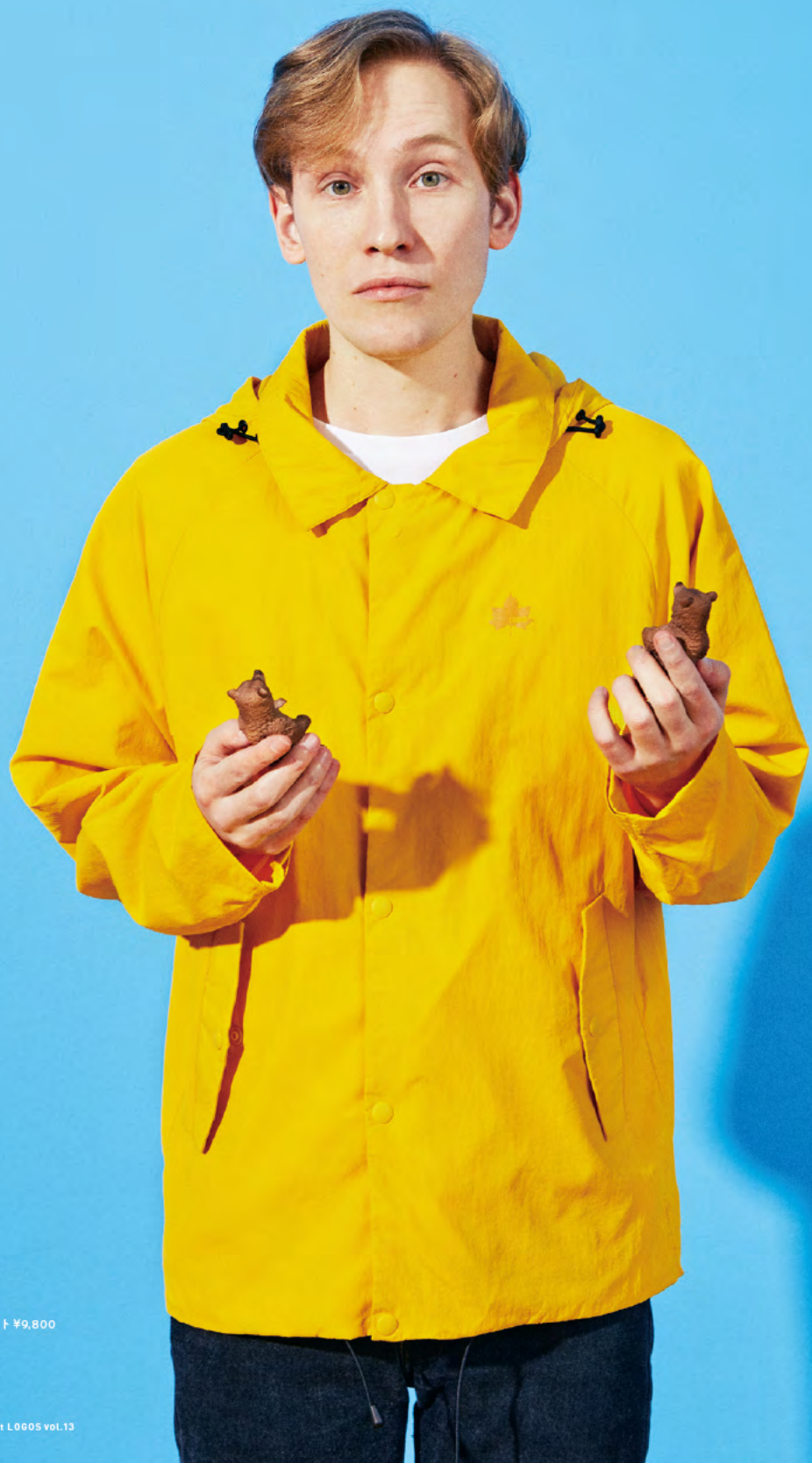
FATHER コーチジャケット ¥9,800